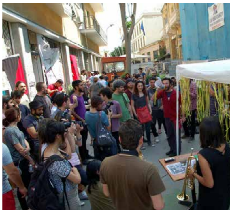
Κατάληψη Νεκρής Ζώνης, OccupyBufferZone (Οκτώβριος 2011-Απρίλιος 2012)